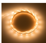
UWW Ultra Warm Weiss Ultra Warm White

5m Rolle LED Flexstreifen mit 30cm langem Anschlusskabel am Anfang und Ende, mit jeweils 0,75mm 2 Leitungsquerschnitt und mit rückseitigem 3M Doppelklebeband.