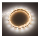
NW Neutral Weiss Neutral White