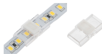
ZU-060-001 SMD Flexstrip Verbinder - Mono 10mm breit SMD Flexstrip Connector - Mono 10mm wide

Weitere Informationen erhalten Sie per QR Code | Get more information via QR Code