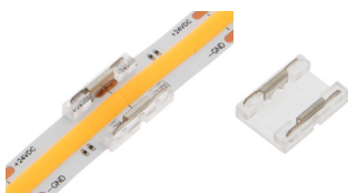
ZU-060-101 COB Flexstrip Verbinder - Mono 10mm breit COB Flexstrip Connector - Mono 10mm wide