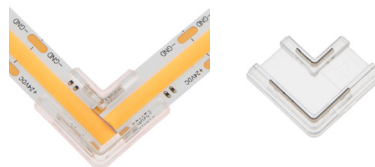
ZU-060-102 COB Flexstrip Eckverbinder - Mono 10mm breit COB Flexstrip Corner Connector Mono | 10mm wide

Weitere Informationen erhalten Sie per QR Code | Get more information via QR Code